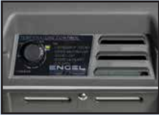
Controller with control light