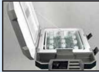
Door swing changeable