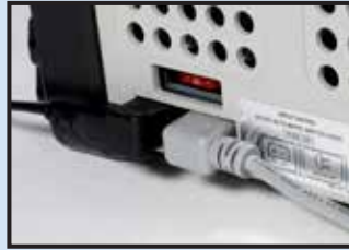
Automatic priority circuit