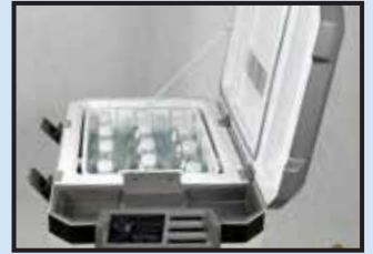
Door swing changeable