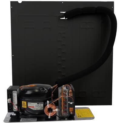
Solar cooling unit | Solar Kältesatz:

Designed for water chillers! Geeignet für wasser Kühlung!