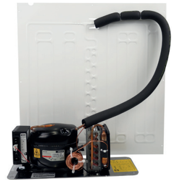
Solar cooling unit | Solar Kältesatz: