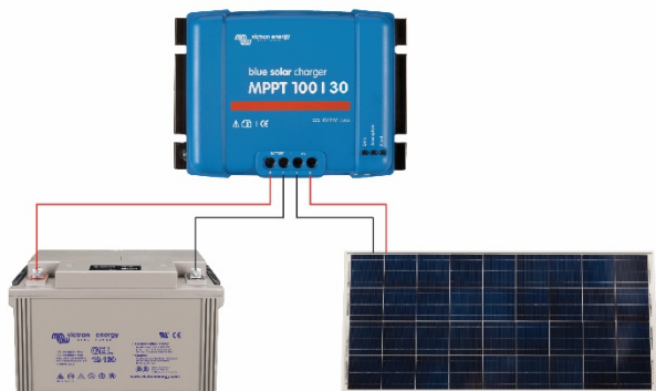
Figure 1: Power connections